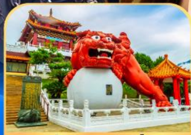
วัดเหวินหลู่